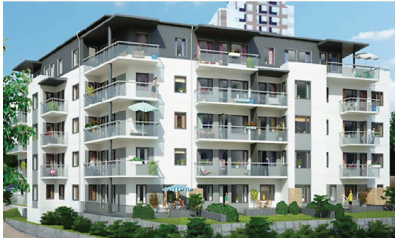
Brf Lovön som byggs på platsen där en förskola tidigare låg.