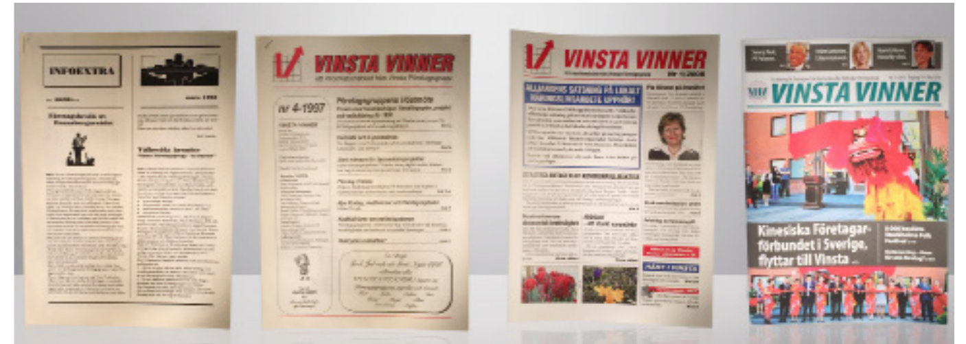
Vinstabladet utveckling från 1995 till 2015.