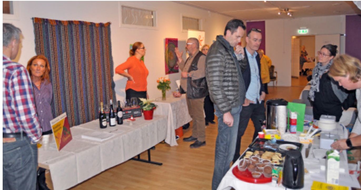
Företagsmässan 2015.